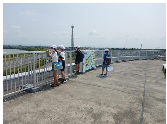
屋上から千歳川・石狩川を眺める