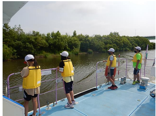
水面がとても穏やか