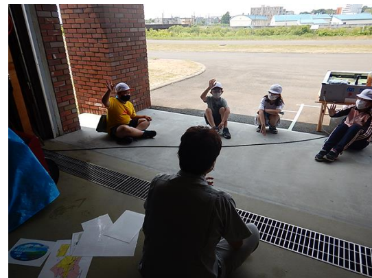
川の水はどこからくるの