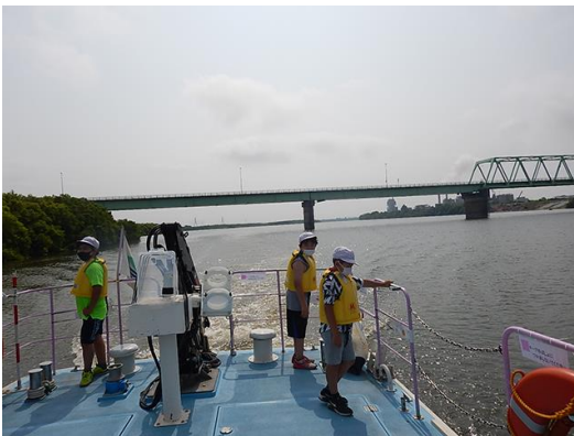
いつも車で通っている橋を川から観察