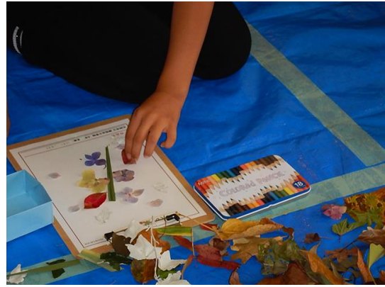
お道具箱は1人一つずつ使います