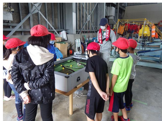
大雨が降ったら川の周辺の家はどうなるのだろう