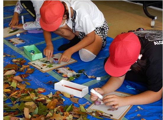
子供の創造力は無限大