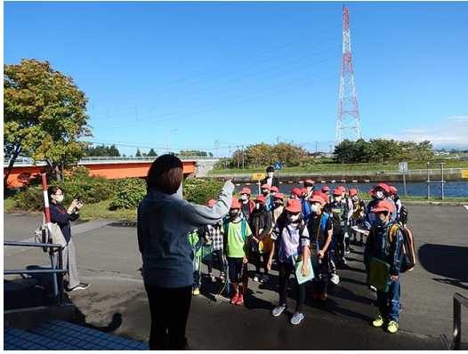
秋晴れ！弁天丸日和！