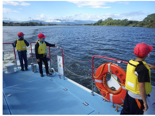
間隔を保ちつつ、川からの景色を楽しむ