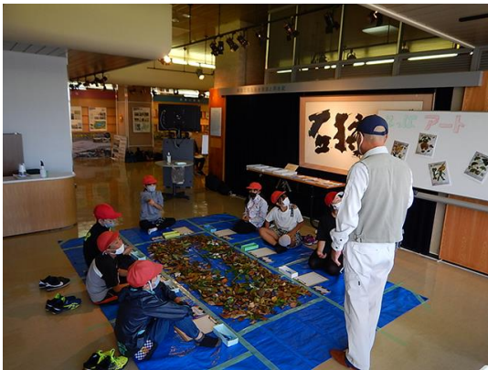
葉っぱの名前や種類の説明をします