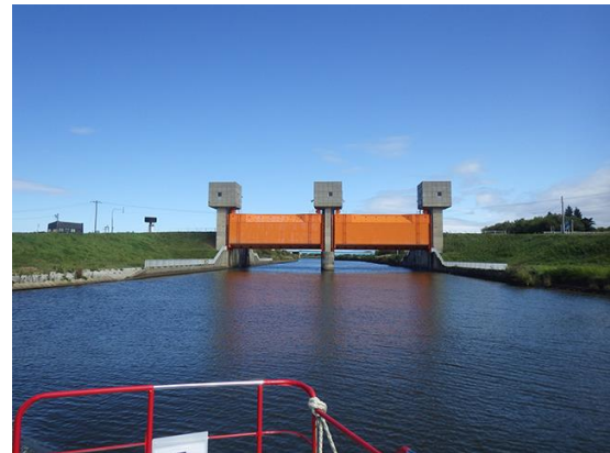
志美運河水門の下をくぐります