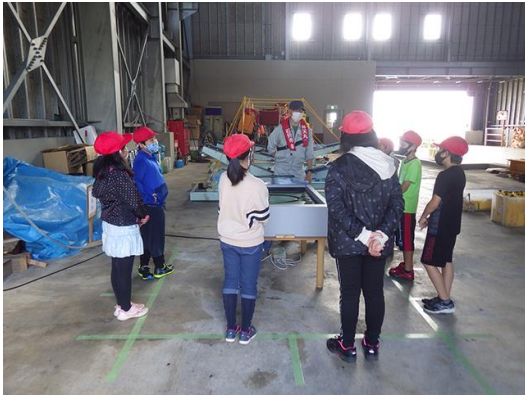
ショートカット工事とは