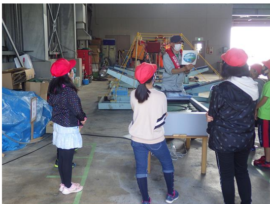
雨が降る仕組みを学びます