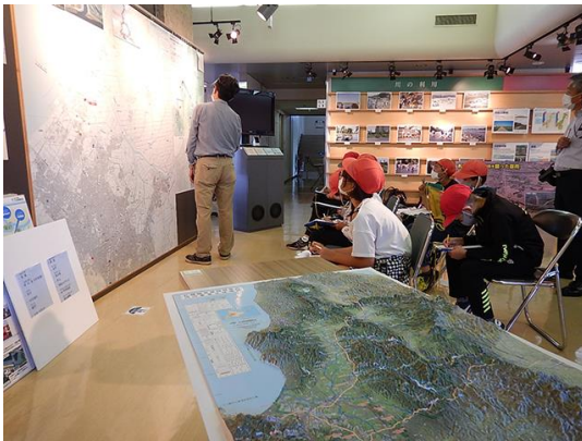
自分達が住む石狩市と川の関係