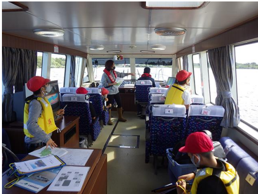
船内からアオサギ発見！