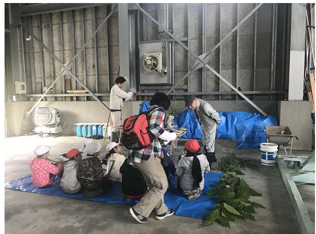
植物の特徴や名前の由来について