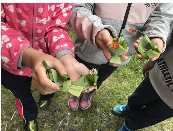
かわいい笹舟できた！