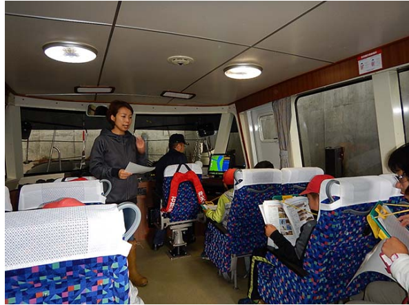
渡船について学びます