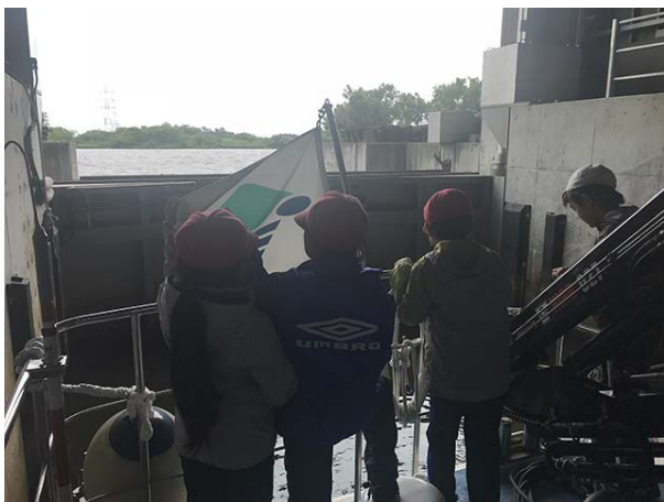
艇庫から茨戸川見学