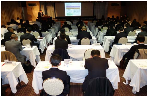
石狩川下流の現状と整備方向について 札幌開発建設部榎河川計画課長