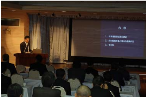
石狩川流域北海道管理区間の現状と整備方向について 北海道建設部土木局河川砂防課松田主幹